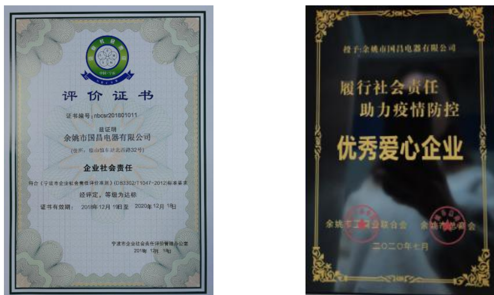
图表7.1-2 社会责任履行